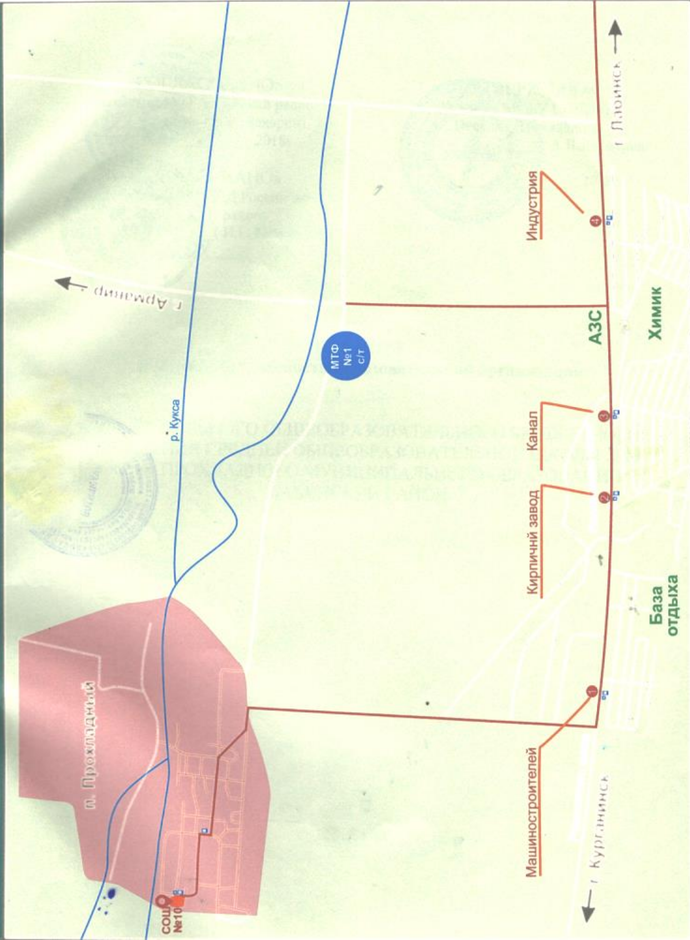
Схема маршрута движения школьного автобуса по перевозке учащихся МОУ СОШ №10 п. Прохладный Лабинского района